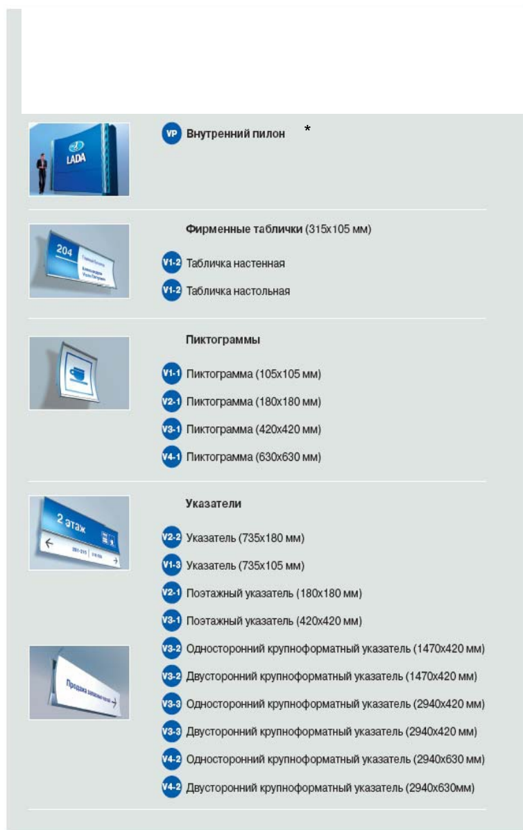
Рисунок Б.1 - Пилон, таблички, пиктограммы, указатели.