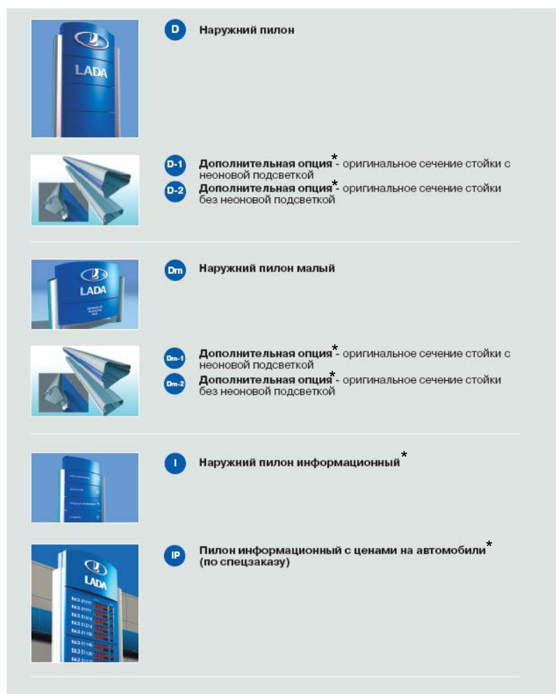
Рисунок А.1 - Наружные пилоны.