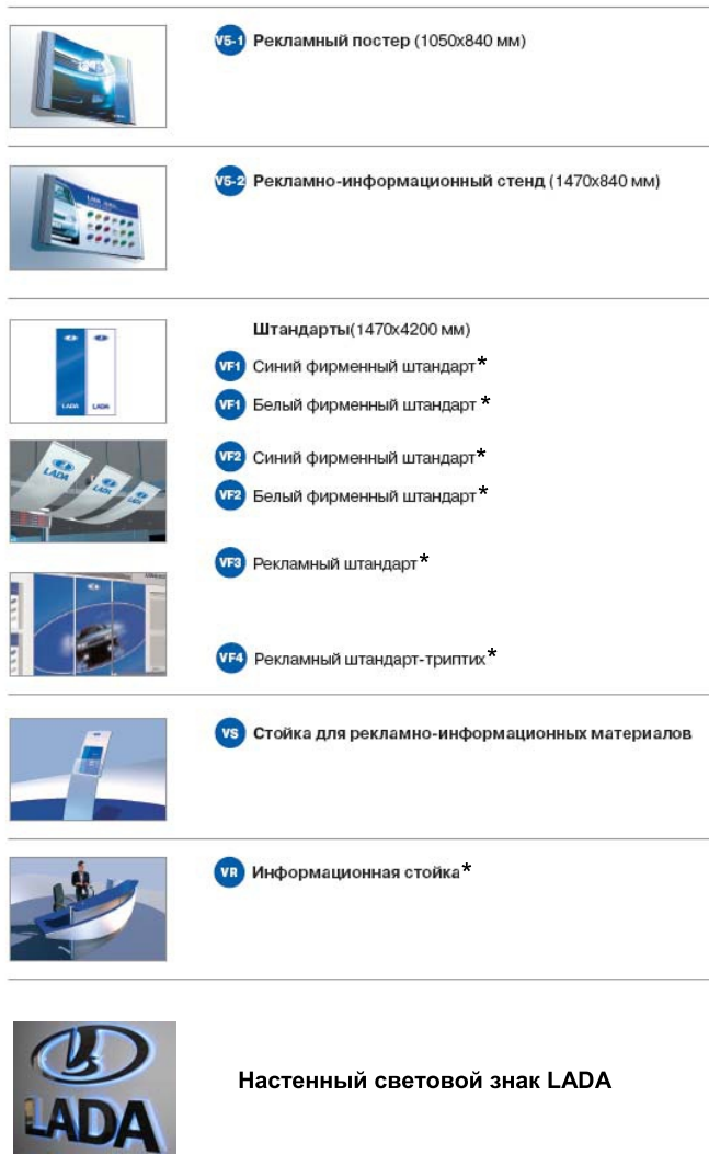
Рисунок Б.2 - Постер, стенд, штандарты, стойки, настенный световой знак