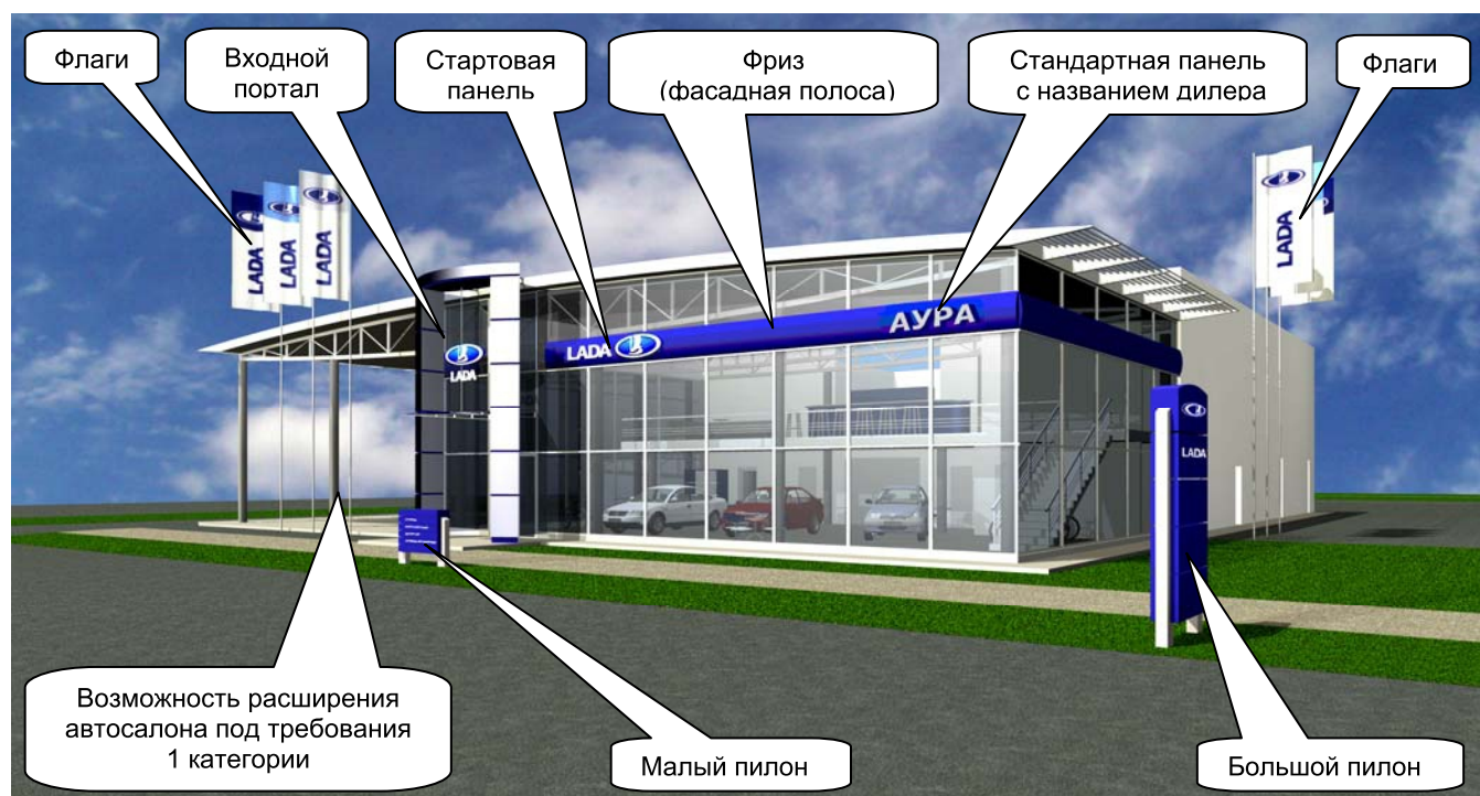
Рис. 5. Размещение элементов внешних визуальных коммуникаций.

Вход в клиентский центр и демонстрационный зал должен быть подчеркнут входным порталом, архитектурными элементами, такими как навесная крыша, большие окна или каким-либо фронтальным дизайном. На фасаде здания может размещаться наименование ПССС. Наименование ПССС может размещаться в виде надкрышной конструкции.